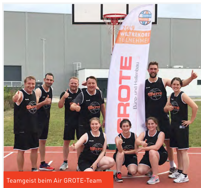
Teamgeist beim Air GROTE-Team

Den Spielern sowie den angereisten Fans war es dennoch eine Freude! Das gesamte GROTE-Team bedankt sich bei dem hervorragenden Gastgeber für die Organisation und