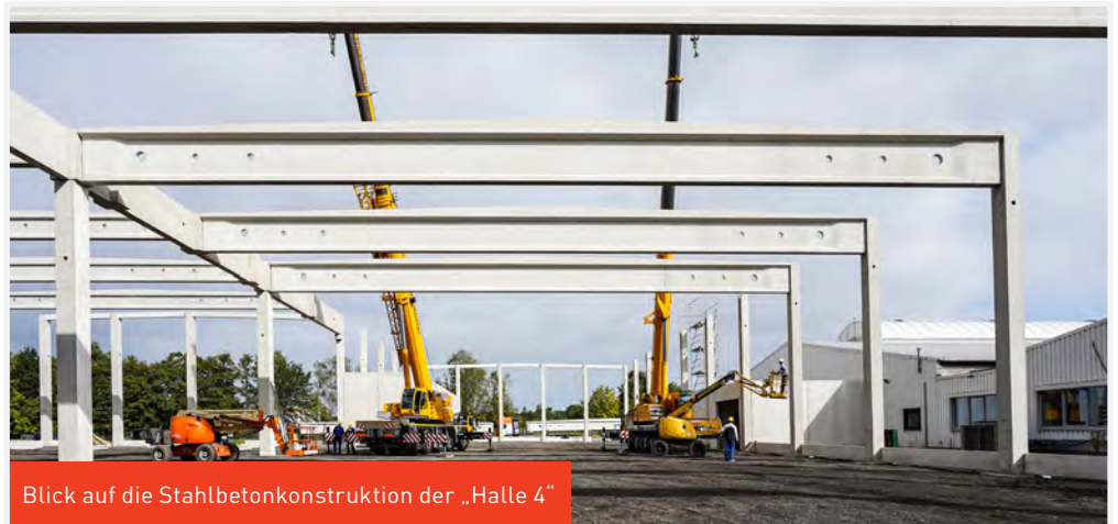
Blick auf die Stahlbetonkonstruktion der „Halle 4“