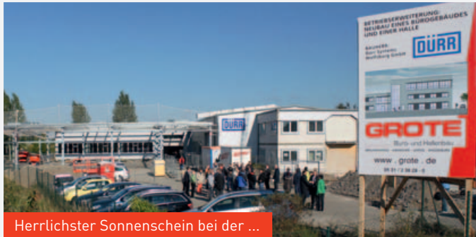
Herrlichster Sonnenschein bei der ...

Nicht nur optisch sondern auch funktional wird der Büro-Neubau, bestehend aus einem dreigeschossigen Bürogebäude und einem zweigeschossigen Verbindungsbau, das Büro-Bestandsgebäude integrieren und aufwerten. Der neue Eingangsbereich mit darüber liegendem Besprechungsraum verbindet zukünftig den neuen und alten Bürobereich der Dürr Systems Wolfsburg GmbH und schafft optimale kurze Wege für alle Mitarbeiter/innen.