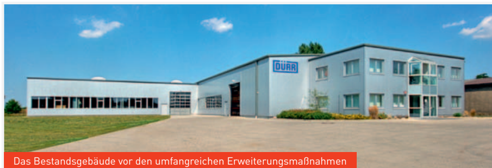
Das Bestandsgebäude vor den umfangreichen Erweiterungsmaßnahmen

Mit der aktuellen zweiten Erweiterung der Produktionshalle und der Erweiterung des bestehenden Bürogebäudes werden die Bestandsgebäude in den Neubau integriert und als eine Einheit aufgewertet.