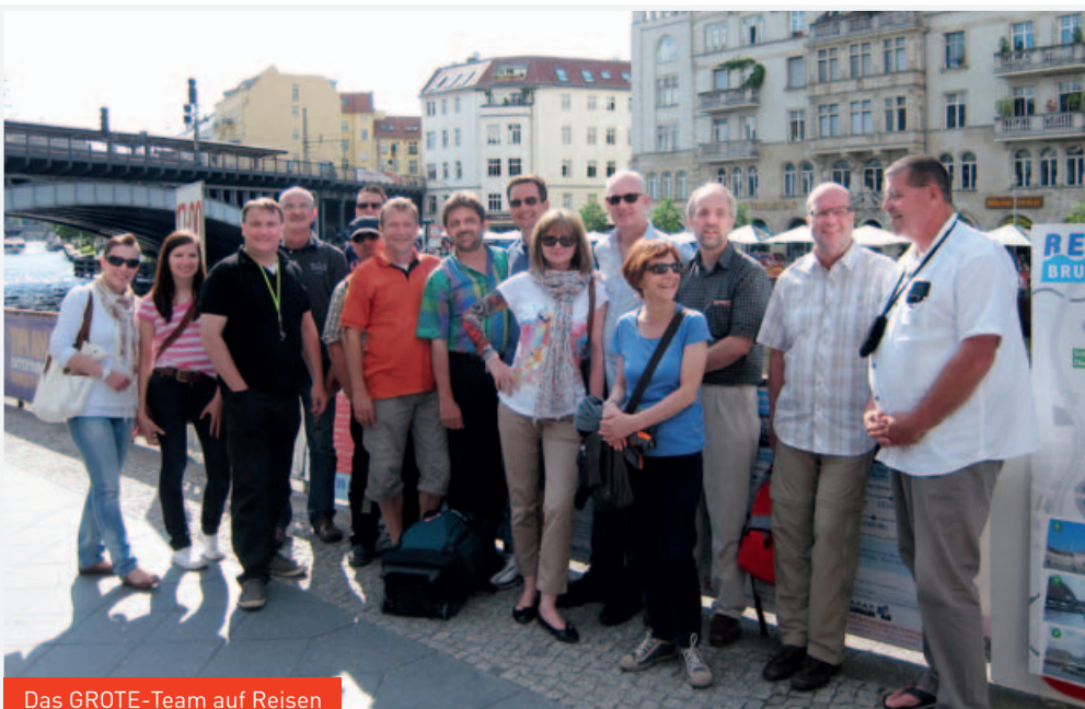
Das GROTE-Team auf Reisen

Unser diesjähriger Betriebsausflug führte uns in die deutsche Hauptstadt. Gemeinsam erkundeten wir die schönsten Flecken Berlins und Potsdams. Das Team zeigte sich begeistert.