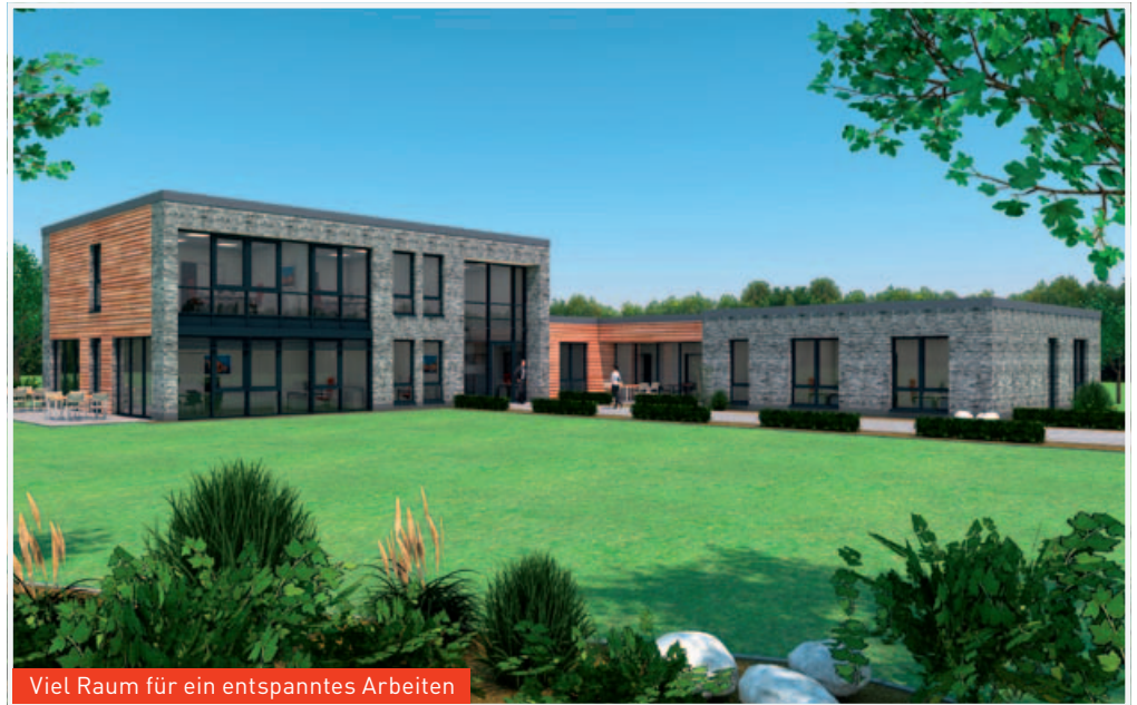
Viel Raum für ein entspanntes Arbeiten

Am grünen Rand der Weltkulturerbestadt Goslar erstellen wir für die Sonnenhotels Deutschland GmbH & Co. KG ein neues Bürogebäude, das die Verwaltung der Sonnenhotels-Gruppe zum Jahresende 2017 beziehen wird.