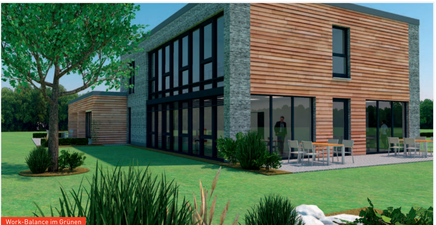
Work-Balance im Grünen