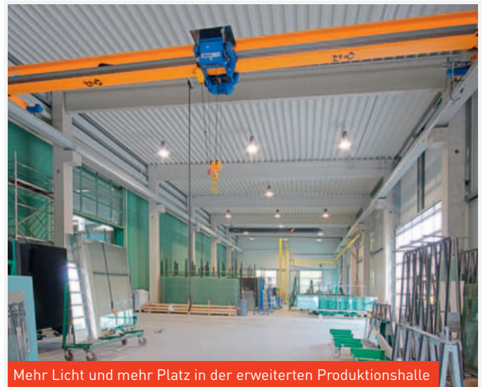
Mehr Licht und mehr Platz in der erweiterten Produktionshalle