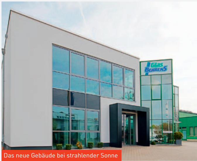
Das neue Gebäude bei strahlender Sonne

In Ausgabe 42 berichteten wir bereits über den Bau- start der August Behrens GmbH & Co. KG in Braun- schweig. Nun ist es an der Zeit, Ihnen die fertiggestell- ten Erweiterungen des Betriebsgebäudes vorzustellen.