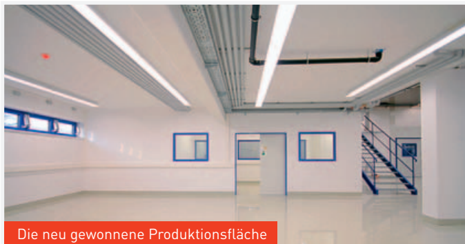
Die neu gewonnene Produktionsfläche

Bekannt für die Herstellung von Werkzeugen zur Produktion von Ringpull-Verschlüssen für Getränkedosen will die Firma nunmehr auch Werkzeuge für die Medizintechnik herstellen. Der dafür benötigte Erweiterungsbau weist eine Nutzfläche von ca. 400m 2 auf.