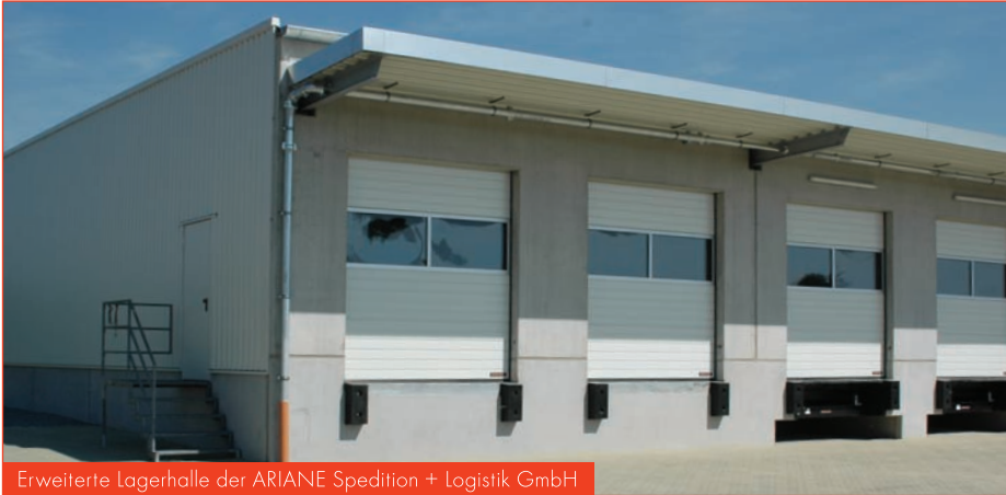
Erweiterte Lagerhalle der ARIANE Spedition + Logistik GmbH

Die Ariane Spedition + Logistik GmbH liefert seit vielen Jahren im Auftrag eines großen Versandhauses sperrige Güter direkt in die Wohnung des Kunden. Durch Umschichtungen im Markt ergab sich Ende 2009 für die Firma Ariane ein deutlicher Auftragsanstieg. Um diesen Anforderungen gerecht zu werden, mussten