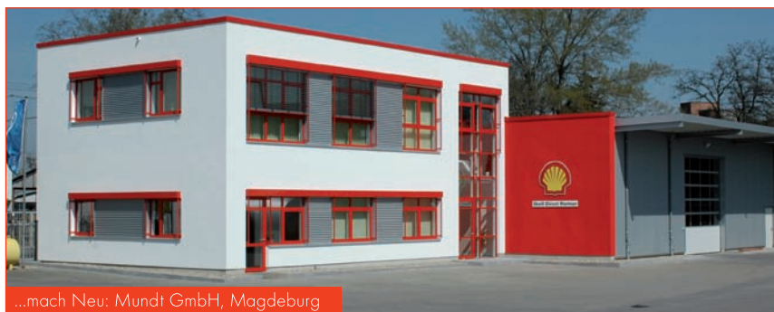
...mach Neu: Mundt GmbH, Magdeburg

Die Entscheidung für eine Erweiterung der Bestandsgebäude oder einen Neubau muss nicht nur das Heute und Morgen, sondern auch das Übermorgen mit berücksichtigen. Für den Endausbau ist die geplante langfristige Geschäftsentwicklung besonders wichtig, denn aus dieser Planung ergibt sich, welche Unternehmensbereiche besonders von der Expansion betroffen sind und daher erweitert werden sollen. Hier lässt sich oft schon erkennen, ob eine Erweiterung im Bestand noch sinnvoll ist oder ein Neubau vorzuziehen ist.